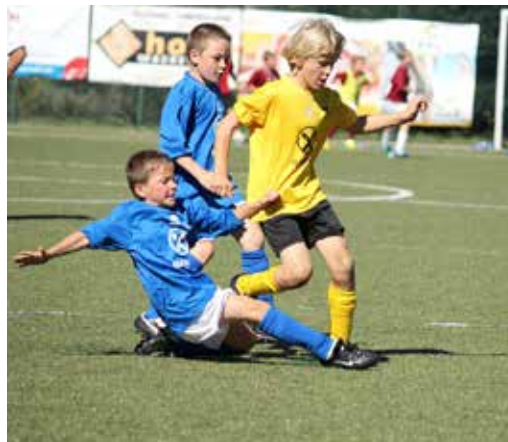
Auch bei den kleinen geht's mit vollem Einsatz und Herzblut zur Sache.