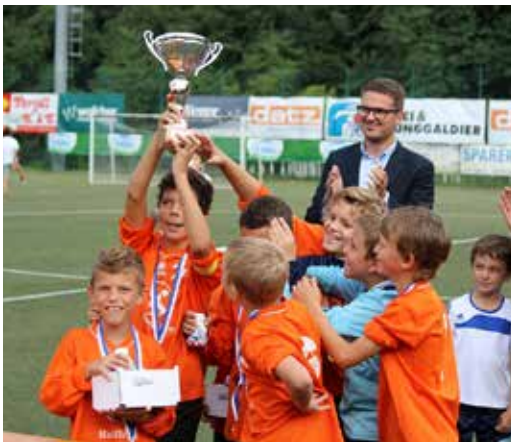
Holten sich im letzten Jahr den begehrten Titel des Arnold Plunger Turniers: Eppan Orange